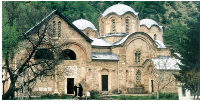
PATRIARCHATE OF PEĆ